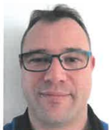
MILON Xavier Sponsors